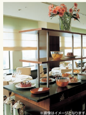
※画像はイメージとなります。

アーキヒルズの最上階に位置する会員制クラブ「アーキヒルズクラブ」。ル・コルビュジエの世界屈指のコレクションが常設された各ダイニング施設では国内外の賓客をお持て成しするに相応しい質の高いサービスとお料理が提供されています。