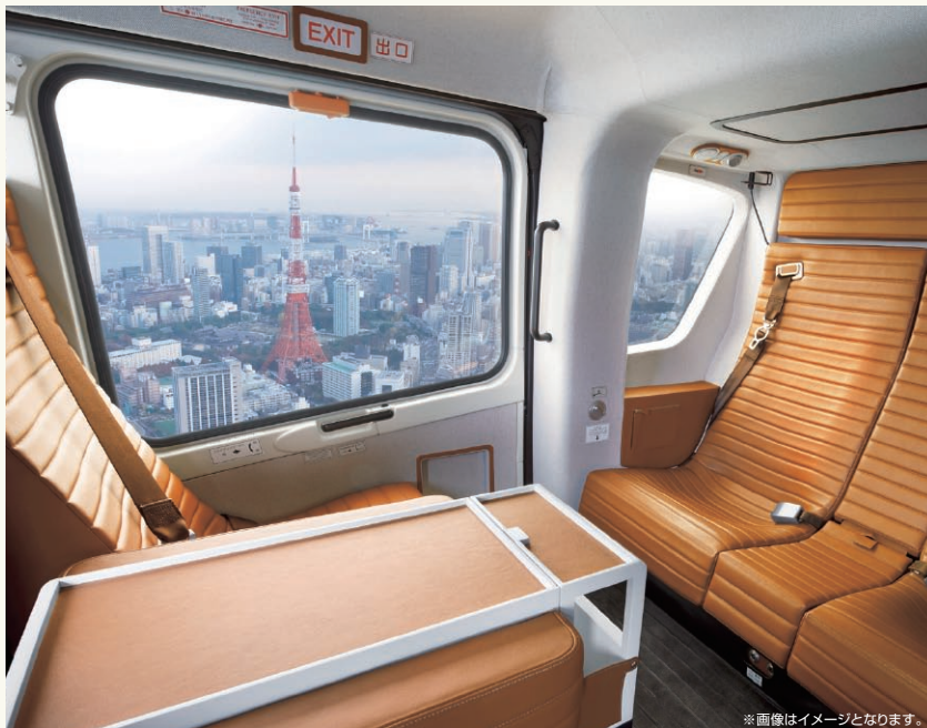
※画像はイメージとなります。

赤坂のアーキヒルズヘリポートからヘリコプターに乗り、東京上空を優雅に空中散歩。 東京タワーや建設中の東京スカイツリー、銀座など東京の主な観光名所を眼下に見ながらのクルーズです。 大切な人との素敵な思い出づくりに『SKYチャータークルーズ』を、是非ご利用ください。